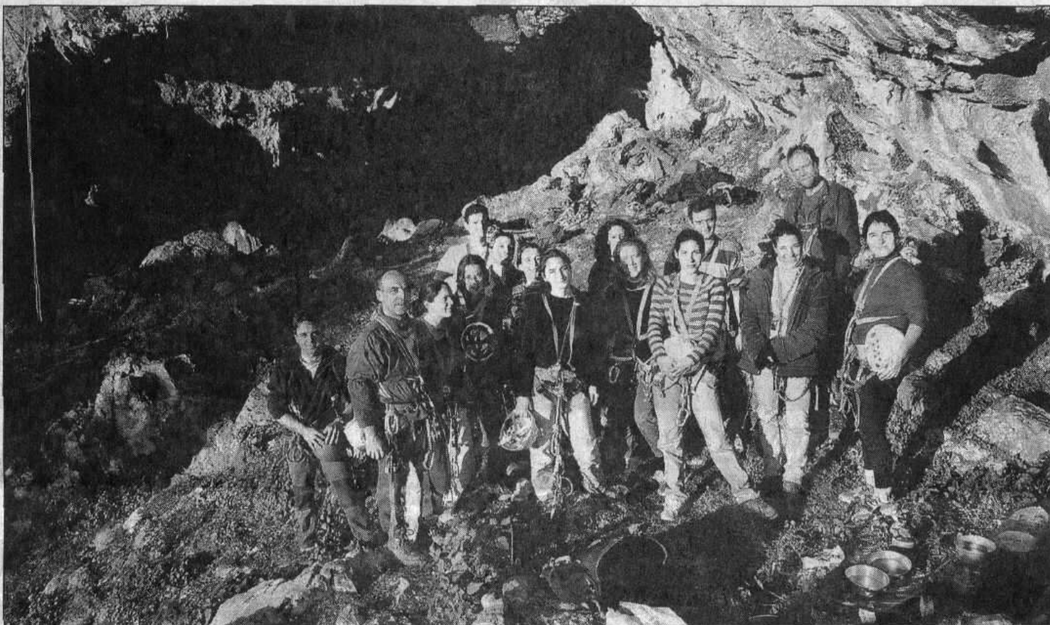
le groupe d'étudiantes à Francardo.