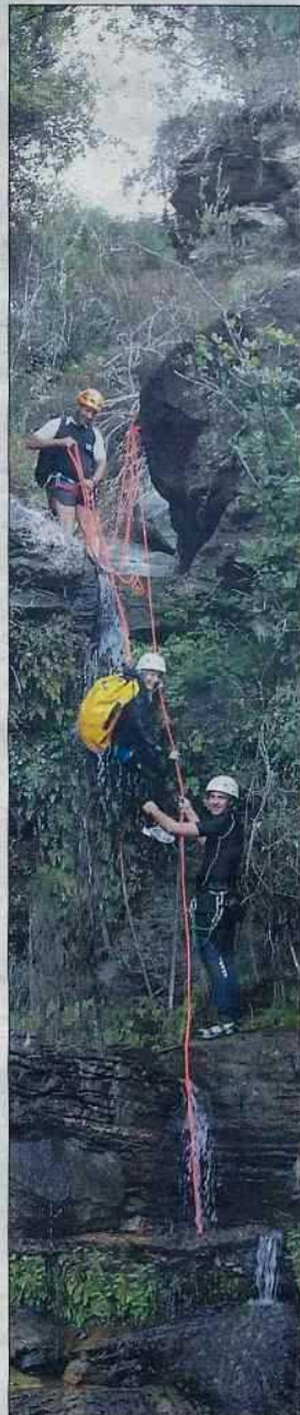
Des descentes en rappel sont proposées dans le canyon de Mandriale.

Aujourd'hui encore de 10 h à 17 h, visite de la grotte de Brando (au-dessus des glaciers) et descentes en rappel (matériel mis à disposition) dans le canyon de Mandriale (qui aboutit à l'embranchement de la route de Figarella au-dessus de Miomo).